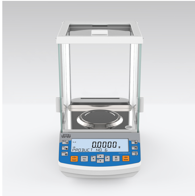
The drawings, photos and graphics used are for illustrative purposes only.

More information on the website mirror.radwag.com/fr/info,w1,ZAE