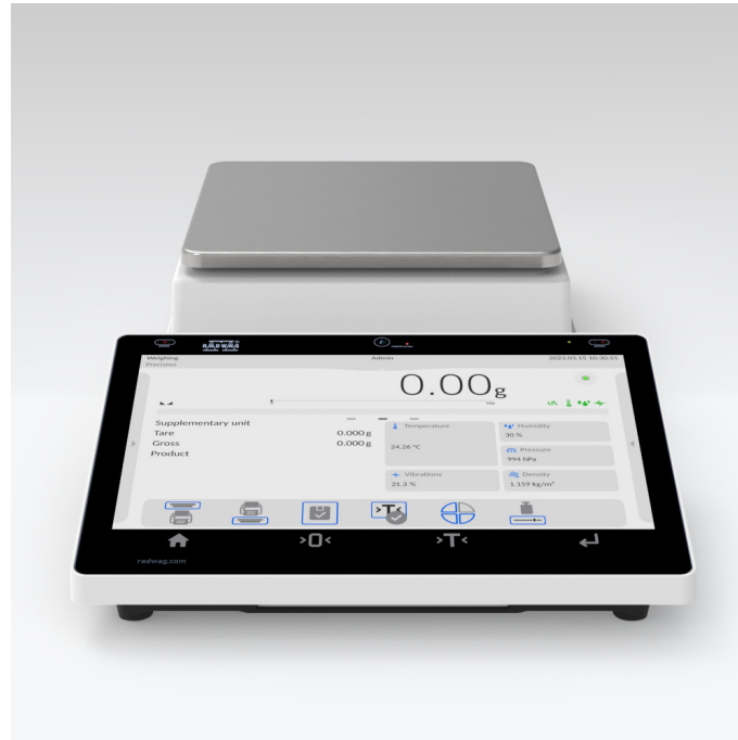
Użyte rysunki, zdjęcia, grafiki mają charakter poglądowy.