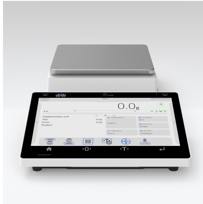
Użyte rysunki, zdjęcia, grafiki mają charakter poglądowy.