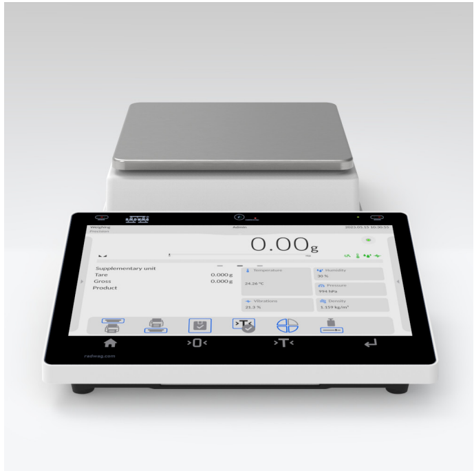
The drawings, photos and graphics used are for illustrative purposes only.