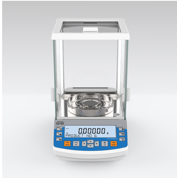
The drawings, photos and graphics used are for illustrative purposes only.

More information on the website mirror.radwag.com/fr/info,w1,NQ5