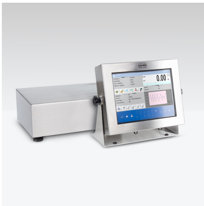
Użyte rysunki, zdjęcia, grafiki mają charakter poglądowy.