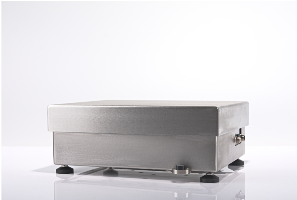
The drawings, photos and graphics used are for illustrative purposes only.