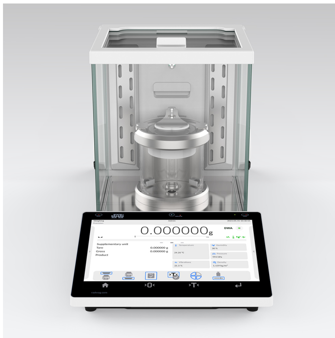
The drawings, photos and graphics used are for illustrative purposes only.

More information on the website mirror.radwag.com/br/info,w1,A0I