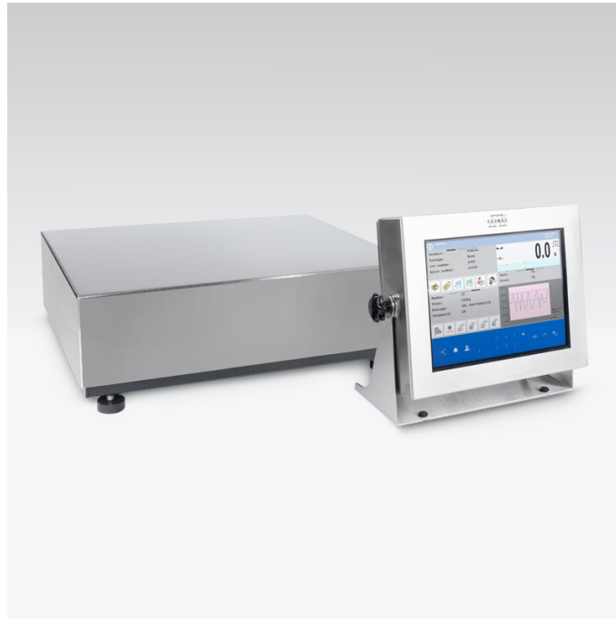
Użyte rysunki, zdjęcia, grafiki mają charakter poglądowy.