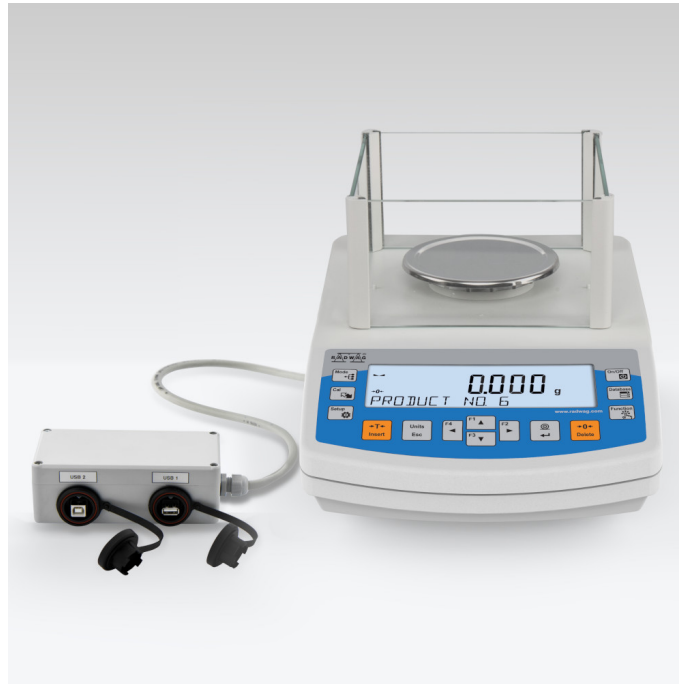
The drawings, photos and graphics used are for illustrative purposes only.

More information on the website mirror.radwag.com/it/info,w1,7C5