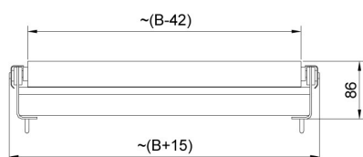
Model w/o limiters