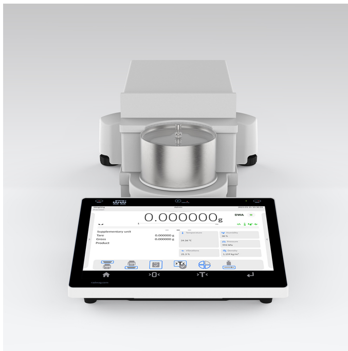
Użyte rysunki, zdjęcia, grafiki mają charakter poglądowy.